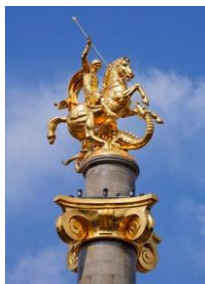
S:t Göran är Georgiens nationalsymbol

Vi besöker Shio Mgvime-klostret som ligger i bergen några mil norr om Tbilisi. Klostret som grundades på 500-talet av munken S:t Shio, en av de 13 syriska fäderna som missionerade i Georgien, är ett av Georgiens största kloster med över 100 bröder. Efter lunch besöker vi Mtskheta, Georgiens gamla huvudstad och religiösa centrum, som också finns med på UNESCOs Världsarvslista. Vi deltar i långfredagsgudstjänsten i Svetiskhoveli-katedralen. Vi besöker ett georgiskt hem och får se hur man målar påskäggen röda.