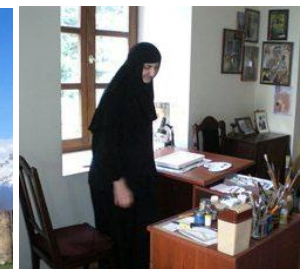
Ikonmålande nunna i Bodbe